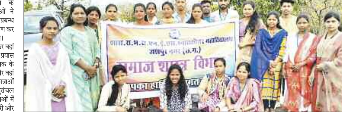
शैक्षणिक भ्रमण के दौरान उपस्थित छात्र- छात्राएं।

जशपुरनगर। शासकीय राम भजन राय एनईएस स्नातकोत्तर महाविद्यालय के समाजशास्त्र विभाग के छात्र-छात्राओं ने बुधवार को अपने प्रोजेक्ट व लघु शोध प्रबन्ध कार्य लिए ग्राम कस्तूरा का शैक्षणिक भ्रमण कर वहां के बारे में संपूर्ण जानकारी एकत्र की। ग्राम पंचायत कस्तूरा के सरपंच से मिलकर वहां के सामाजिक समस्याओं को जानने का प्रयास किया। साथ में शारदा धाम के संस्थापक के माध्यम से वहां की सामाजिक समस्या और वहां चल रही गतिविधियों के बारे में छात्र-छात्राओं ने जानकारी प्राप्त की। इस दौरान दुरांचल ग्रामीण क्षेत्रों में शिक्षा की समस्या, युवाओं में नशापान की समस्या, मनरेगा की जानकारी और विभिन्न प्रकार के विषयों के बारे में जानकारी एकत्र कर उस विषय में गहनता पूर्वक अध्ययन किया। भ्रमण के दौरान छात्राओं ने वनभोज के माध्यम से आपसी सहयोग एवं समरसता का परिचय दिया। इस शैक्षणिक भ्रमण का उद्देश्य