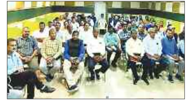
कार्यक्रम में उपस्थित अधिकारी व कर्मचारी।