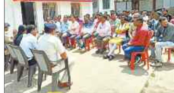
शांति समिति की बैठक में उपस्थित नागरिक व पुलिस अधिकारी।