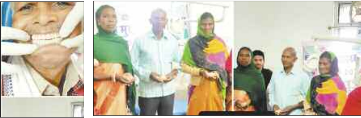
वर्ल्ड ओरल हेल्थ डे मनाने पहुंचे मरीज।

हरिभूमि न्यूज ►► जशपुरनगर कलेक्टर के निर्देशन व मुख्य चिकित्सा एवं स्वास्थ्य अधिकारी के मार्गदर्शन में बुधवार को राष्ट्रीय मुख्य स्वास्थ्य कार्यक्रम अंतर्गत विश्व मुख स्वास्थ्य दिवस का आयोजन जिला चिकित्सालय एवं सामुदायिक स्वास्थ्य केंद्रों में किया गया। इसमें मेगा डेंचर कैम्प अंतर्गत जशपुर जिले के 83 जकरतमंद लोगों को निःशुल्क 50 पूर्ण व 33 आंशिक डेंचर का विवरण जिला